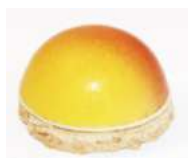
Dôme à la noix de coco