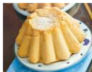
Biscuits de Savoie