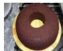
Savarin au chocolat